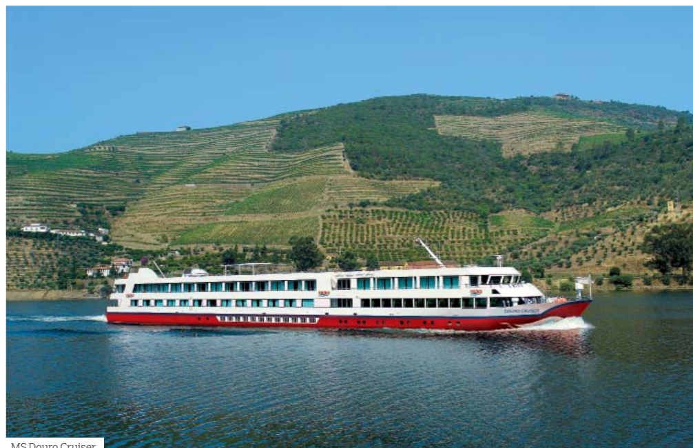
MS Douro Cruiser

Grundprogramm 20 Personen (muss seitens des Veranstalters bis 28 Tage vor Reisebeginn erreicht werden).