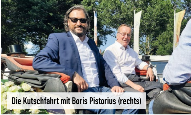
Die Kutschfahrt mit Boris Pistorius (rechts)