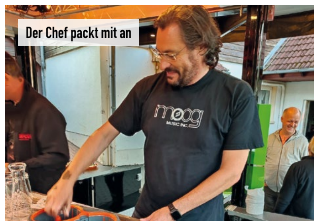
Der Chef packt mit an