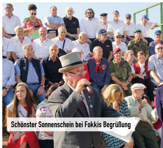
Schönster Sonnenschein bei Fokkis Begrüßung