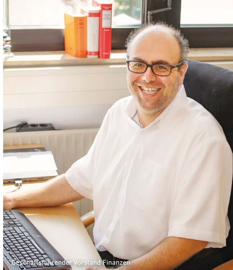
Geschäftsführender Vorstand Finanzen

Uns in der Stiftungsfamilie ist es wichtig, besonders an diese Menschen zu denken. Deshalb ist der Aufenthalt aller Kinder und Jugendlichen bis zur Vollendung des 15. Lebensjahres in unseren Hotels und Ferienwohnungen ab 2023 kostenfrei. Deshalb halten wir unser Preisniveau möglichst gering, um Men-