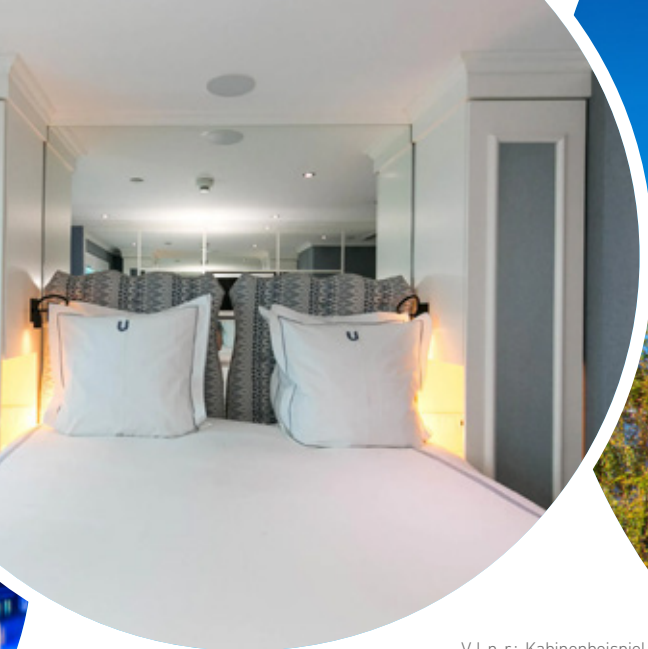
V. l. n. r.: Kabinenbeispiel Hauptdeck; Bamberg