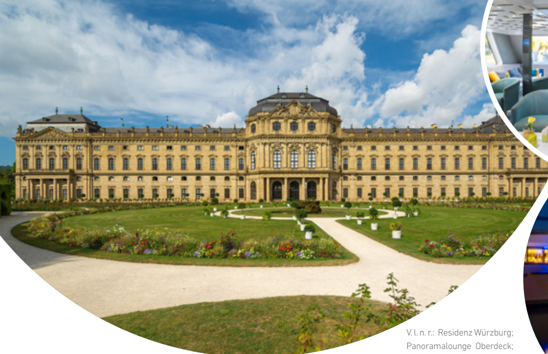
V.l.n.r.: Residenz Würzburg; Panoramalounge Oberdeck; MS OTELLO