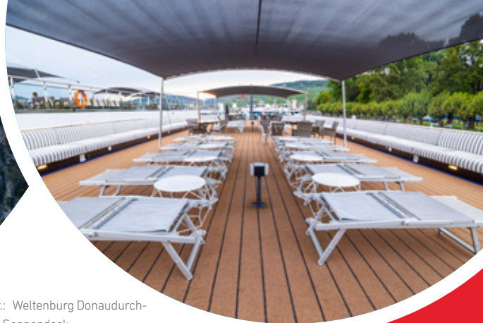
V.l.n.r.: Weltenburg Donaudurch- burch; Sonnendeck