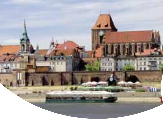
V. l. n. r.: Marienkirche in Thorn, Masurische Seen, Danzig