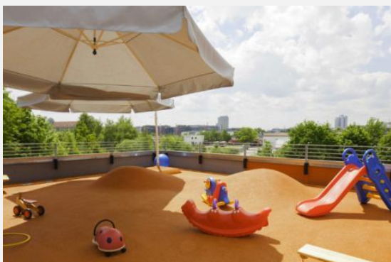
Impressionen aus der Wichtel Akademie Neuhausen