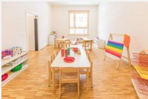
Impressionen aus der Wichtel Akademie Westend