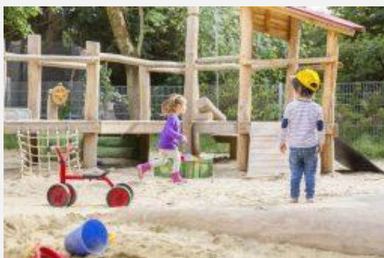
Impressionen aus der Wichtel Akademie Nymphenburg