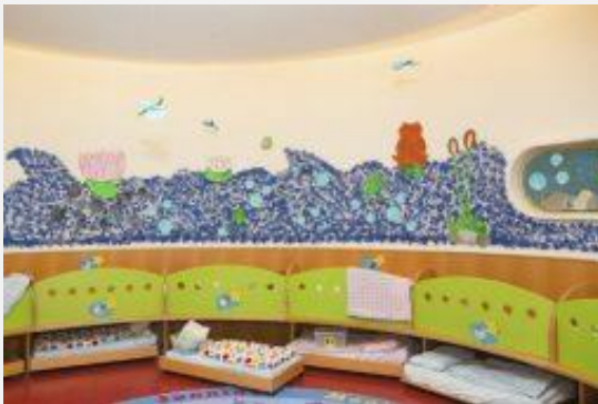
Impressionen aus der Wichtel Akademie Laim