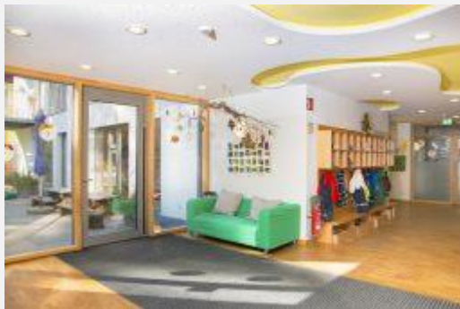
Impressionen aus der Wichtel Akademie Harlaching-Mitte