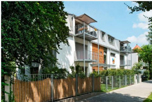
Impressionen aus der Wichtel Akademie Pasing