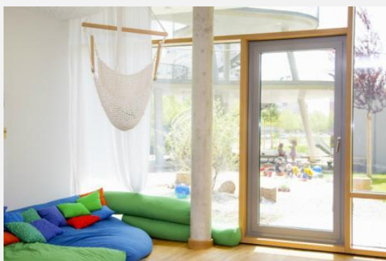
Impressionen aus der Wichtel Akademie Parkstadt-Schwabing