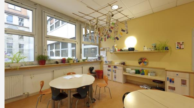
Impressionen aus der Kita „Stepping Stones“