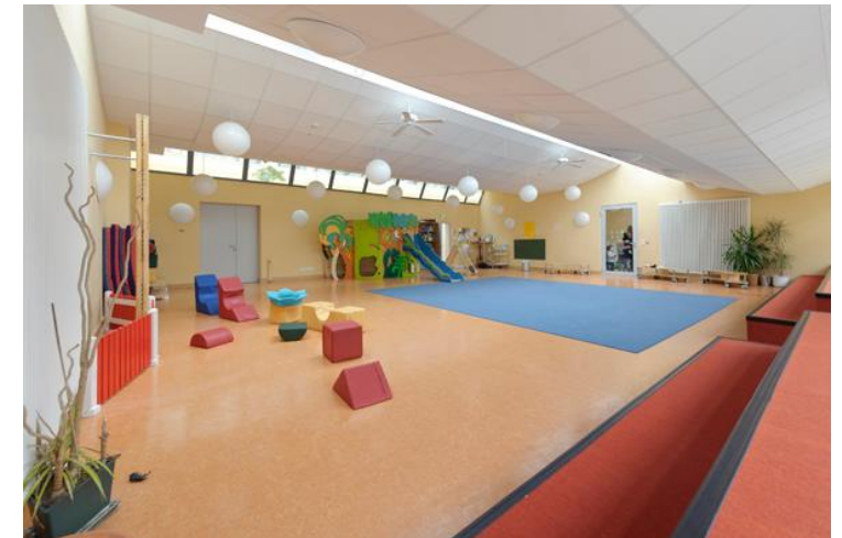
Kita „Stepping Stones“