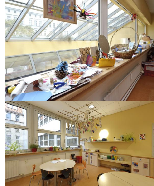
Impressionen aus der Kita „Stepping Stones“