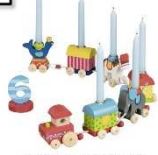
Geburtstagszug mit Zahlen 1-6