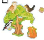
Würfelspiel: Wer wohnt wo?