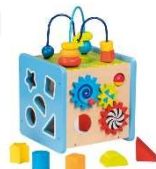
Aktivität- und Motorikwürfel