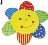
Hör- und Fühlsonne