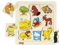
Legespiel: Wo wohne ich?