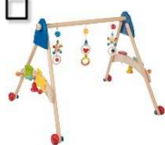
Greif und Spieltrainer