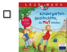
Kindergarten-Geschichten, die Mut machen