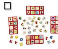
Mein ABC Spiel