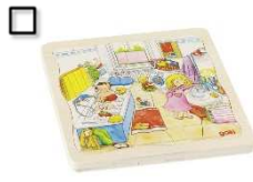
Puzzle Mein Tag