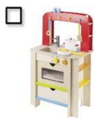
Küche mit Zubehör