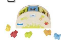
Sortierbox: Wer frisst was?