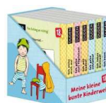
Meine kleine bunte Kinderwelt