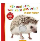
Hör mal rein, wer kann das sein? In der Natur