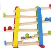
Kugelbahn mit Xylophon