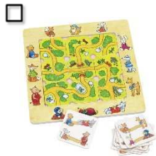
Legespiel: Finde den Weg