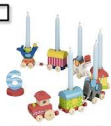
Geburtstagszug mit Zahlen 1-6