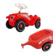
Bobby-Car mit Anhänger