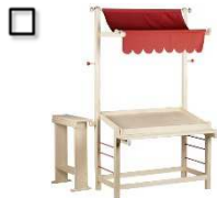
Marktstand mit Zubehör