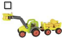
Frontlader mit Heuwagen