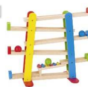
Kugelbahn mit Xylophon