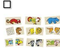
Puzzle und Memo