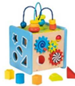
Aktiv- und Motorikwürfel