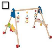
Greif und Spieltrainer