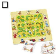
Legespiel: Finde den Weg