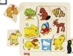
Legespiel: Wo wohne ich?