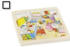
Puzzle Mein Tag