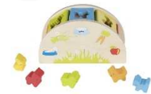
Sortierbox: Wer frisst was?