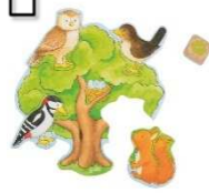
Würfelspiel: Wer wohnt wo?